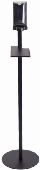
Dispenser Sterisol Art.nr. 51042