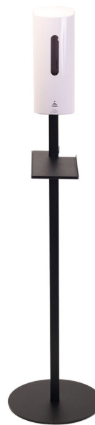
DAX Automatisk Dispenser 700 ml Art.nr. 30056