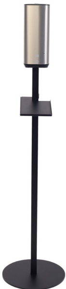
Tork Dispenser Sensor S4 Art.nr. 50245